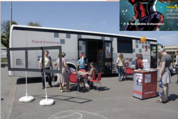
Svět knihy, pojiždná knihovna