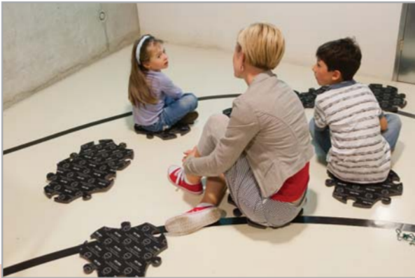
Pražská muzejní noc, Dejvice